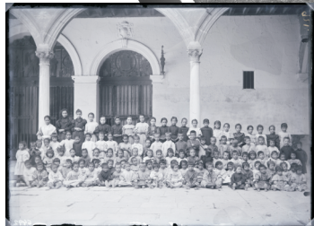
Retrato de grupo en un hospicio (Cádiz) Negativo de vidrio. 13x18. (a00081_ar)

El Archivo Fotográfico tiene su origen en el Fichero de Arte Antiguo recopilado por las secciones Arte y Arqueología del antiguo Centro de Estudios Históricos, continuado y ampliado por el Instituto Diego Velázquez y después por el Departamento de Historia del Arte del Instituto de Historia del CSIC. Las colecciones y fondos que integran este Archivo son fruto del trabajo de los investigadores que han pasado por este departamento, además de diversas adquisiciones y donaciones . Hoy, la Unidad de Tratamiento Archivístico y Documentación se encarga de gestionar los fondos como instrumento para la investigación y de coordinar las funciones de conservación, descripción y difusión .