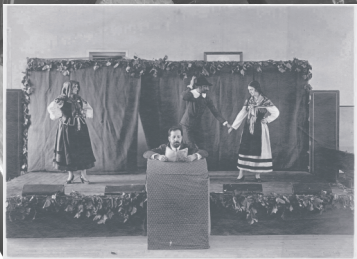
Representación teatral en la Residencia de Estudiantes Copia en papel. 13x18. Fondo Montesinos. (ADCH 936/319)