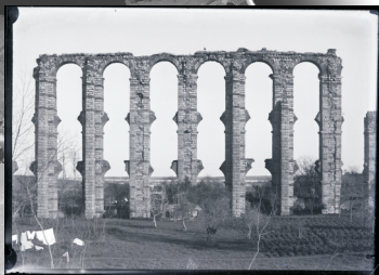
Acueducto de los Milagros en Mérida Placa de vidrio. 13x18. (a04997)