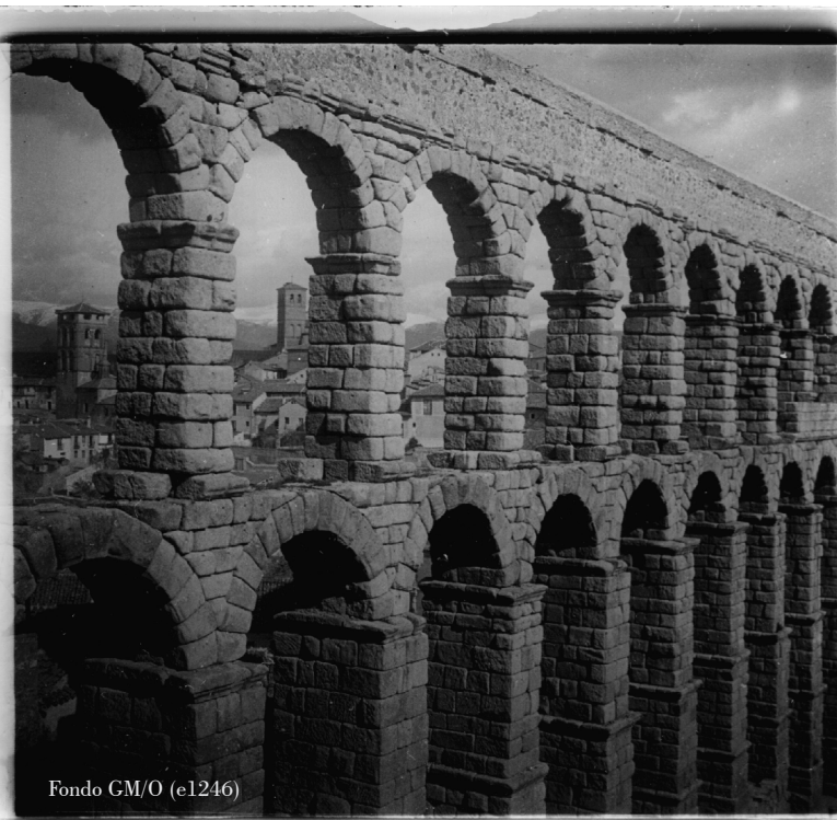
Fondo GM/O (e1246)

A través de las actividades de la IX Semana de la Ciencia se quiere dar a conocer los fondos del Archivo Fotográfico por su importancia para la actividad científica, los distintos procedimientos y técnicas utilizados en la historia de la fotografía así como el trabajo de la UTAD para la conservación y custodia de la colección.