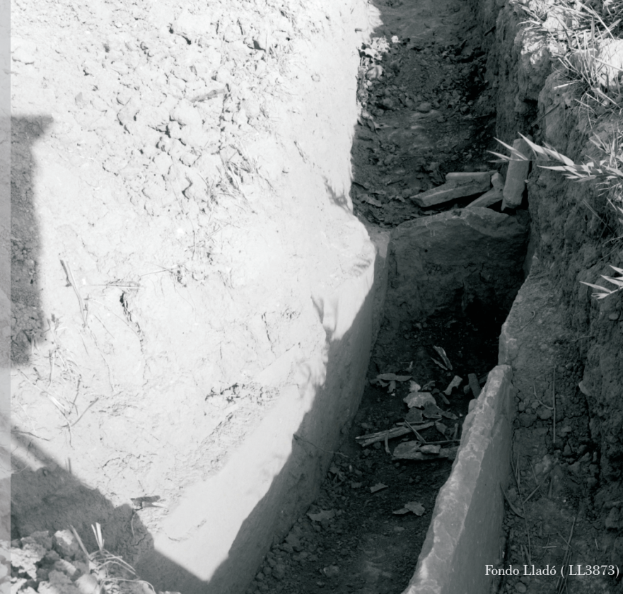
Fondo Lladó ( LL3873)

http://www.cchs.csic.es/web_UTAD/index.html Horario de 9:30 a 14:00 c/Albasanz 26-28 28037 Madrid (Spain)